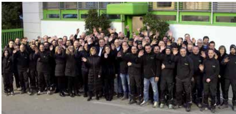
Tutti i dipendenti dell'azienda.

La quotidianità è mutata per tutti e non vi sono purtroppo ancora certezze riguardo alla situazione futura. La Gehri ha preso il problema di petto ed ha imparato ad affrontare la propria attività con modalità finora sconosciute, implementando il telelavoro per il personale di vendita e amministrativo, utilizzando maggiormente i media elettronici per diffondere informazioni ai dipendenti, a clienti, partners e fornitori e dotandosi di tutti gli accorgimenti igienico-sanitari necessari nel rispetto delle misure emana-